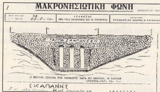
Η Γέφυρα του Σοφοκλή Μαντά. Σκίτσο.

Ο Σάνος έχασε το φίμωτρό του. Προσοχή! Αντιλυσσικές ενέσεις δεν υπάρχουν.