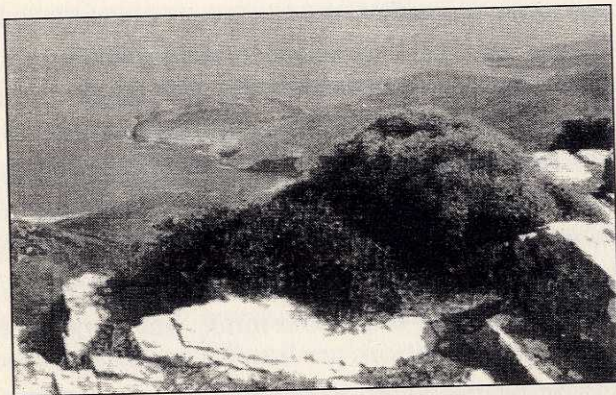
Τοπίο Μακρονήσου. Χαμηλή βλάστηση σ' ερημικό ακρογιάλι.