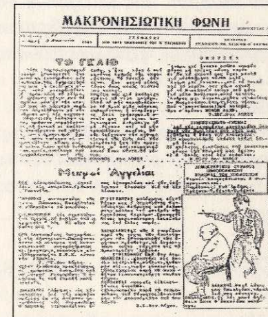
Πρώτη σελίδα της «ΜΑΚΡΟΝΗΣΙΩΤΙΚΗΣ ΦΩΝΗΣ».