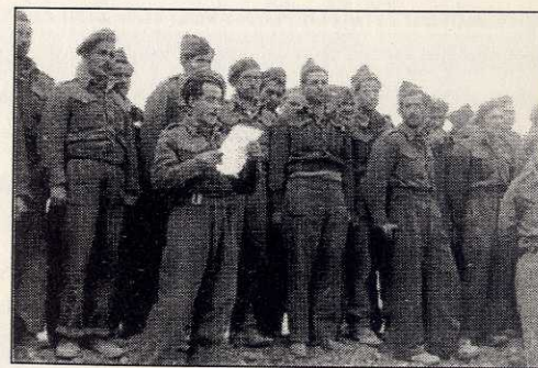
Στο μικρό κωματόδρομο που συνδέει το λιμάνι με το Διοικητήριο. Ποιον επίσημο διερχόμενο προσφωνώ;