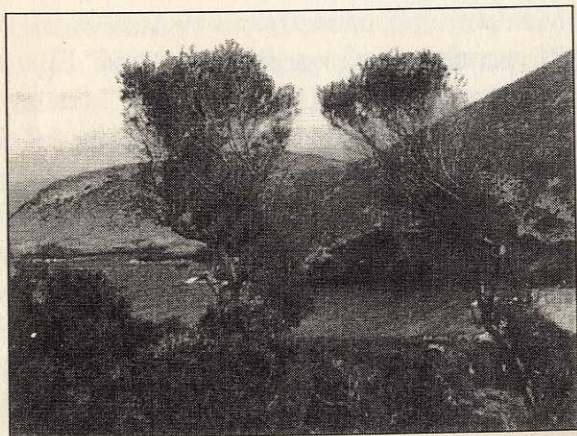
Τοπίο στο βόρειο άκρο της Μακρονήσου.

Μετά τις δηλώσεις μετανοίας, η διαπαιδαγώγηση και αναμόρφωση των στρατιωτών περνούσε σε δεύτερο, υψηλότερο επίπεδο. Συνεχιζόταν «δια της πειθούς». Αυτό το «καθήκον» το είχαν εξ ολοκλήρου αναλάβει τα Γραφεία Ηθικής Αγωγής (Γ.Η.Α.).