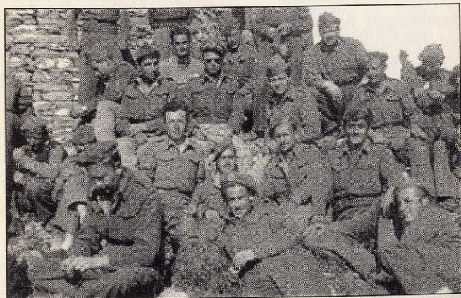
Ο 2ος λόχος αναπαύεται.

Τα συναισθήματά μου ήταν περίεργα και δεν θα μπορούσα να τ' αποδώσω με ακρίβεια. Δεν θα ήμουν πάντως ειλικρινής αν έλεγα ότι αισθανόμουν ντροπή. Στενοχωρήθηκα και αγανάκτησα όμως γιατί δεν είναι ευχάριστο να σε εξαναγκάζουν να κάνεις αυτό που θέλουν οι άλλοι. Δεν είχα την εντύπωση ότι πρόδωσα τις πεποιθήσεις μου. Ο αγώνας είχε τελειώσει, τα ιδανικά για τα οποία αγωνιστήκαμε στην Κατοχή τα ενταφιάσαμε μόνοι μας στη Βάρκιζα. Ίσως να ήταν καλύτερα έτσι, σίγουρα ήταν καλύτερα. Το οριστικό συμπέρασμα πάντως θα έβγαине πολύ αργότερα: «Ευτυχώς που ηττηθήκαμε». Η νεκρανάσταση που επιχειρούσαν σήμερα με τον λεγόμενο Δημοκρατικό Στρατό ήταν τυχοδιωκτική και επικίνδυνη. Για μένα το δίλημμα να με φάει η Σκύλλα ή να με καταπιεί η Χάρυβδη