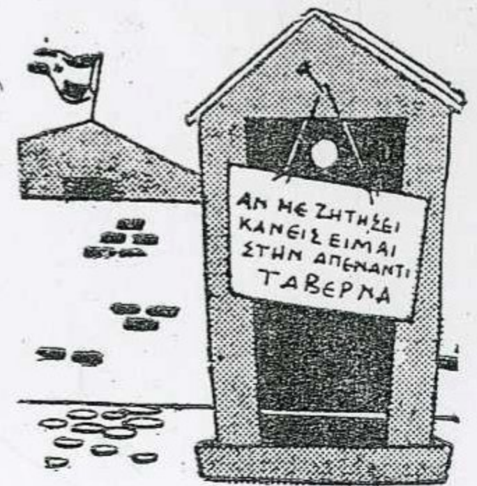
« Ο εύσυνείδητος σκοπός ! ! »

Στο δεύτερο τμήμα της έκθεσεως πληροφορούμεθα το πρόγραμμα των υπό εκτέλεσιν έργων έως το 1952—53. Συγχρόνως βλέπομε ένα εξαιρετικά ενδιαφέρον συγκριτικό διάγραμμα σχετικό με τις ετήσιες κατ' άτομον καταναλώσεις στην