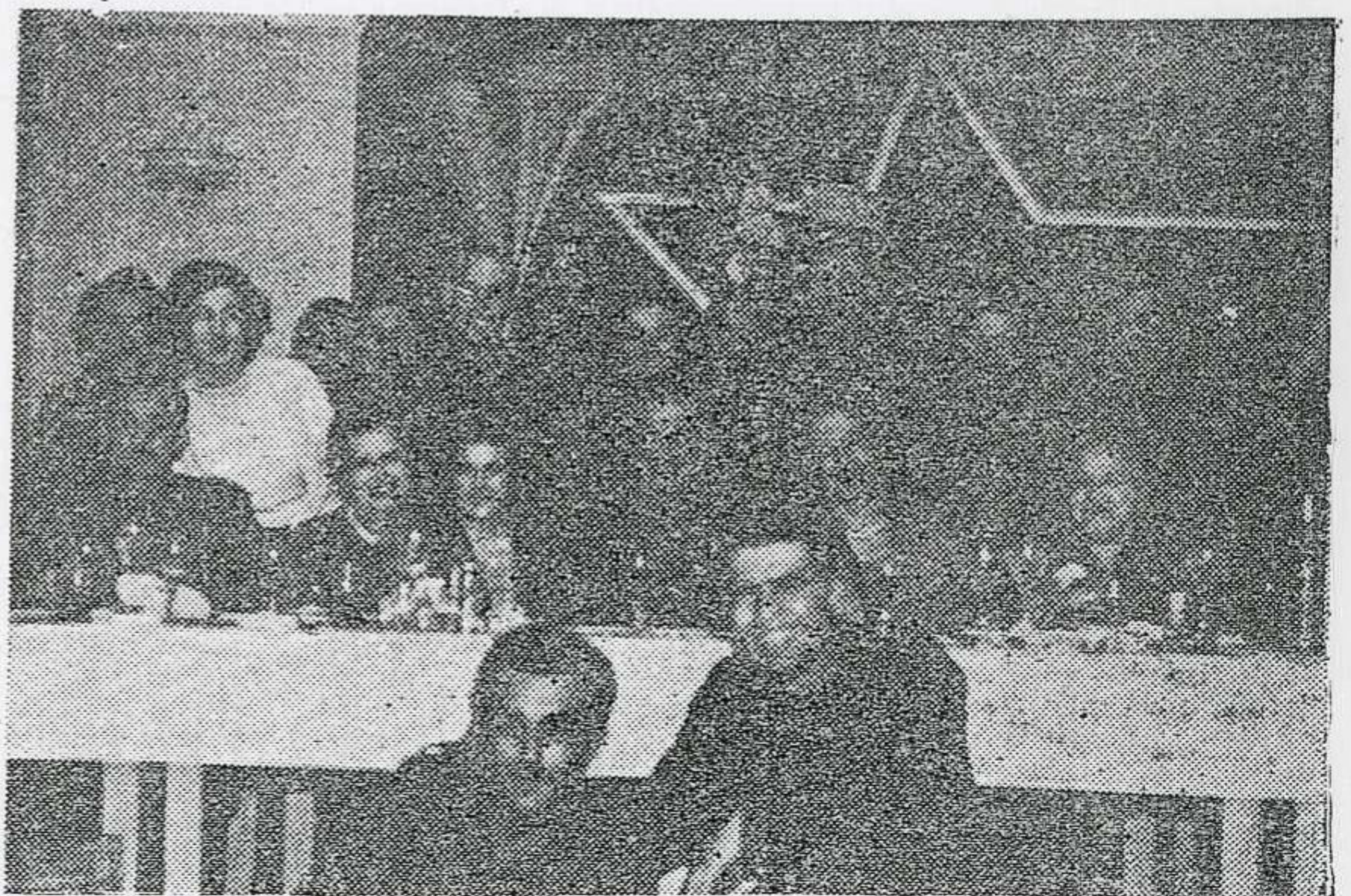
Μία ώραία φωτογραφία από τόν έορτασμό τής Πρωτοχρονιάς στη Μακρόνησο. Διακρίνεται ό Γεν. Δ)τής του Ο. Α. Μ. Ταξίαρχος Γ. Μπαϊρακτάσης μετά τής συζύγου του, ό Γεν. στρατηγός κ. Θ. Μπαρμπας, ό Δ)τής του Α' ΕΤΟ κ. Α. Βασιλόπουλος μετά τής συζύγου του, διαγ)ρχης κ. Άναγνωστόπουλος κ. λ. π. έπισκέπται και άξιωματικοί.