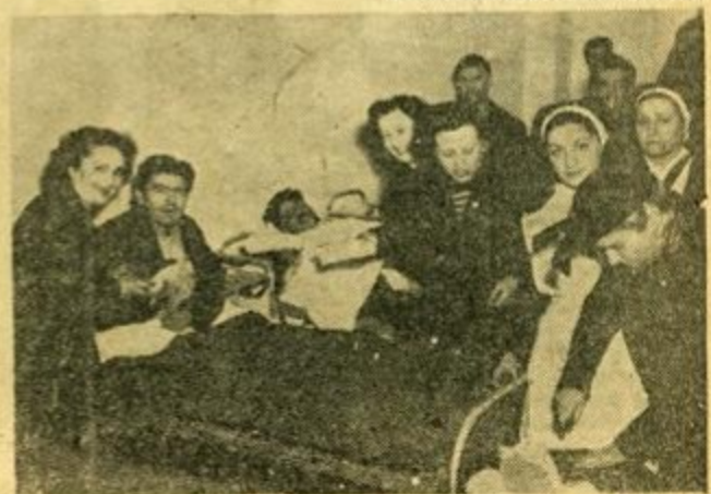
Ἀντιπροσωπεία τῆς Ἐνώσεως Οἰκογενειῶν Στρατοῦ ἐπισκέπτεται τοὺς ἠρωτῶν τραυματίας εἰς ἕνα τῶν νοσοκομείων μας καὶ κόπτεται μαζὺ τους τὴν ἐπίτητα.