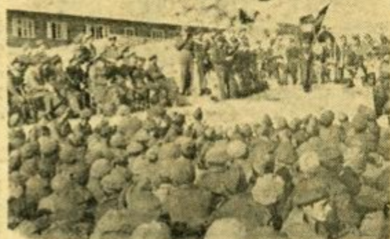
ΑΝΩ: 'Από την συμμετοχή της Μακρονήσου εις τὸ ἐθνικὸν πένθος διὰ τὸ ἀπαίσιον ἔγκλημα τοῦ Σλαυο-συμμοριτισμοῦ. ΑΡΙΣΤΕΡΑ: 'Ερημωμένοι οἱ δρόμοι τῆς Ἀθήνας διαδηλώνουν τὴν δόξην τοῦ ἜΘΝΟΥΣ διὰ τὸ ἀνόσιο παιδομάζωμα.