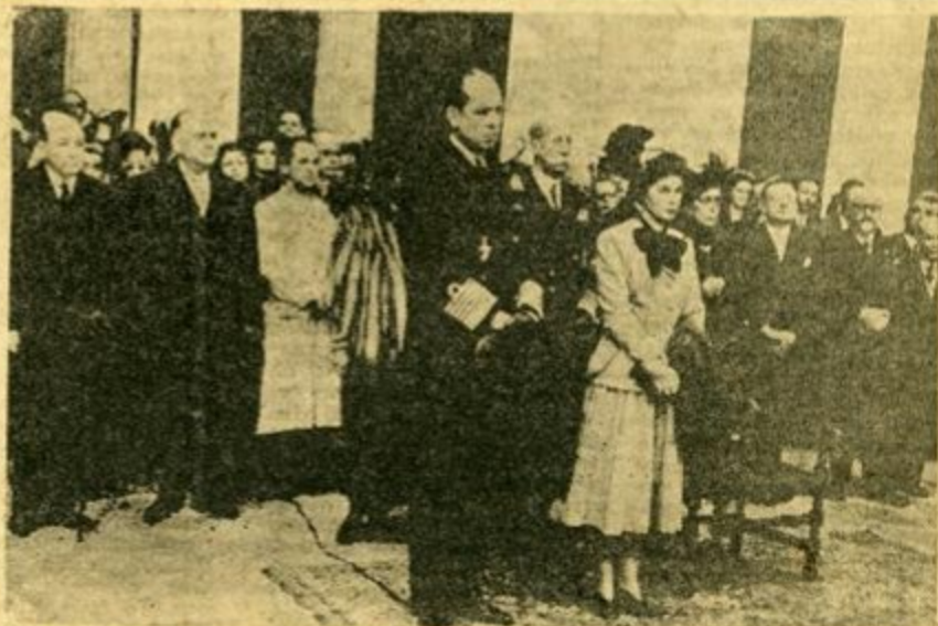
ΑΙ Α.Α.Μ.Μ. ΟΙ ΒΑΣΙΛΕΙΣ ΜΕΤ' ἄλλων ἐπίσημων παρίστανται εἰς τὰ ἐγκαίνια τῆς Ἐκθέσεως Λαϊκῆς Χειροτεχνίας, ἣ ὁποία ἤνοιξε τὰς θύρας τῆς εἰς τὸ μέγαρον τοῦ Ζαππείου καὶ ἐμφανίζει μίαν ἀπὸ τὰς ὀραιότερας ἐπιτεύξεις τοῦ ἔθνους ἐπὶ τοῦ καλλιτεχνικοῦ πεδίου