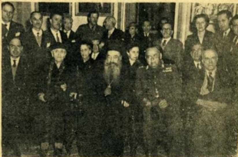
Από την τελευταία σύσκεψη, υπό την προεδρία του Άρχιεπισκόπου της Πανελληνίου Επιτροπής διά τον έπαναστατησμών των άπαχθέντων Έλλη. πούδων