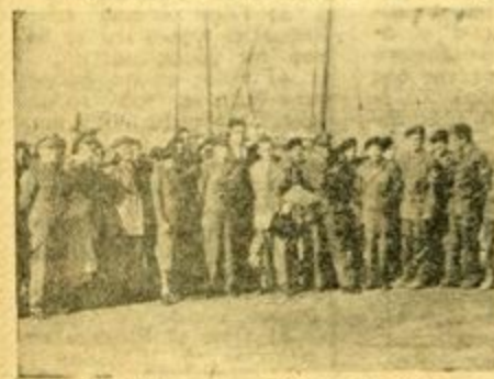
Οἱ ἔξνοι μας εφθάνουν εἰς Μακρονήσον.