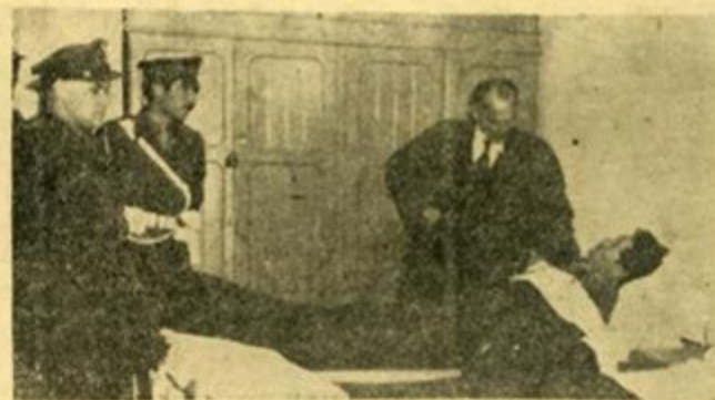
Ὁ Ὑπουργὸς τῶν Στρατιωτικῶν κ. Κανελλόπουλος ἐπισκέπτεται ἐπ' εὐκαιρίαν τῶν ἑορτῶν τοὺς νοσηλευομένους εἰς τὸ 401 στο. Νοσ. βόρειος τραυματίας.

νίξε διάφορα ἐμβλήματα. Τὸ βράδυ στὴ λέσχῃ ἀξιωματικῶν