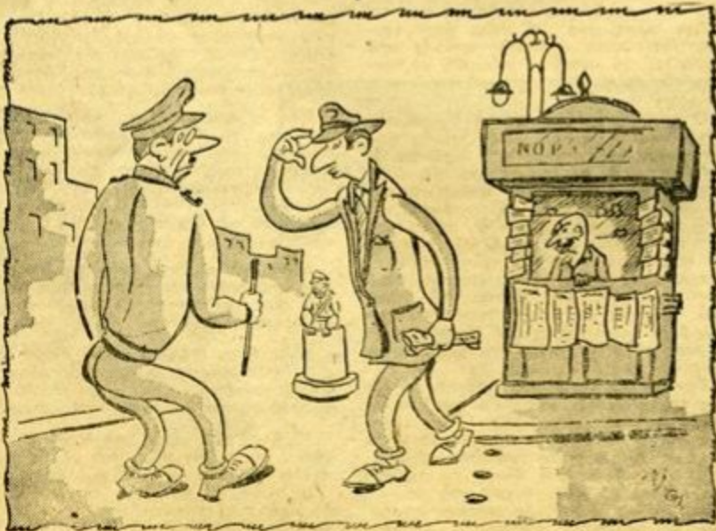
—Βρε Κοιτιόλουε ξεχάσεις πῶς ἀπολύθῃς;

«Τὰ παράσημα δίδονται δὲν ζητοῦνται...».