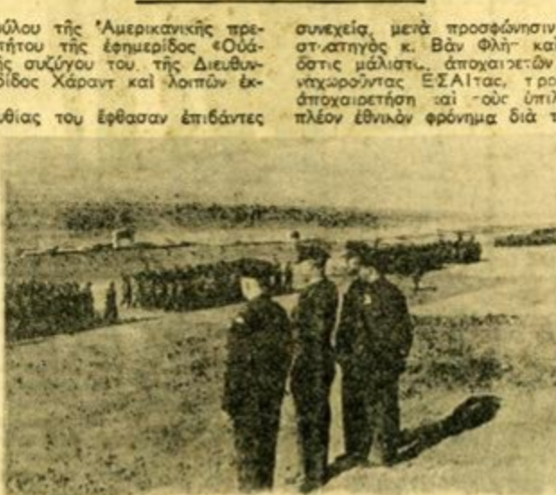
Ὁ Στρατηγὸς κ. Βὰν Φλὴτ, ὁ Γεν. Δ)ντ)ς τοῦ Ο.Α.Μ. Ταξ. κ. Μπαϊρακτάρης, κ.λ.π. παρακολουθοῦν εἰς Μακρονήσον παρελάσιν τῶν ἀνδρῶν τοῦ Α' Ε.Τ.Ο.

συνεχεῖς, μετὰ προσφώνησιν ἰδιωτῶν, ὡμίλησαν δ' ὀλίγων ὁ στρατηγὸς κ. Βὰν Φλὴτ καὶ ὁ ταξίαρχος κ. Μπαϊρακτάρης, ὅστις μάλιστα ἀποχαιρέτην τοὺς κατ' ἐκείνας τὰς ἡμέρας ἀνεχωροῦντας Ε.Σ.Α.Ι.α.ς, τρῶσθαι ἐπιβάρησις εἰς τὴν ἀποχαιρέτησιν καὶ τοὺς ὑπολοίπους, ἀνεχωροῦντας μετὰ ἀκμαῖον πλέον ἔθνικον φρόνημα διὰ τὰς ἐστίας τῶν.