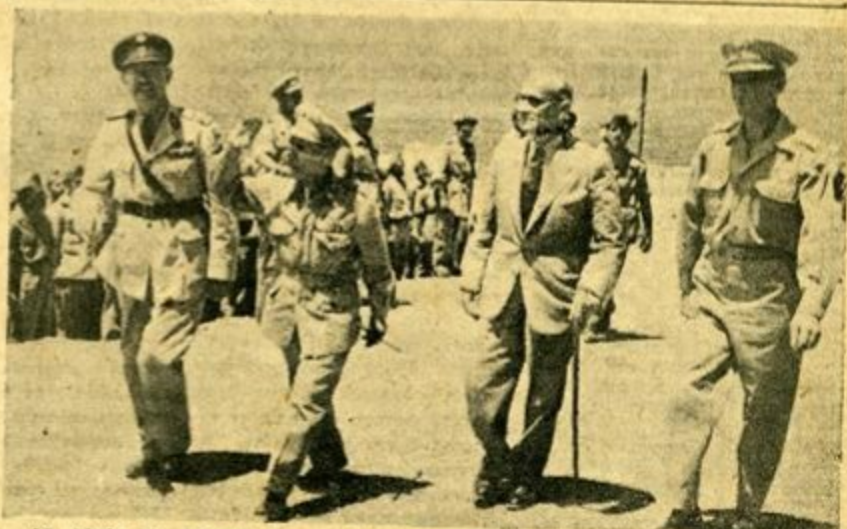
Ο Δ)της της Α.Σ.Δ.Α.Ν Αντιστράτηγος κ. Γ. Παπαγεωργίου και ο τέλος ύπουργός κ. Γ. Στρατός, έπιβηθόν τον Β'Ε.Τ.Ο. συνοδεύόμενοι υπό του Δ)ντου ΒΧΙ)ΓΕΣ Σιν)ρχου κ. Γ. Μπαϊρακτάρη και Δ)του του Β'Ε.Τ.Ο κ. Τζανετατό

Ο ΔΗΜΟΣΙΟΓΡΑΦΟΣ κ. ΛΑΜΠΡΟΣ Γ. ΚΟΡΟΜΗΛΛΑΣ : «Πιστεύω ότι έλοι οι πολίται πρέπει να πράξουν, να γνωρίσουν και να ζήσουν στην Μακρόνησο. Τότε θα νοιώσουν ότι είναι Έλληνες και πώς σαν Έλληνες έχουν περισσότερα καθήκοντα απ' όσα σήμερα μοιάζουν, ή ίσως πιστεύουν ότι έχουν. Έδώ ή κανείς έναν άλλον άέρα».