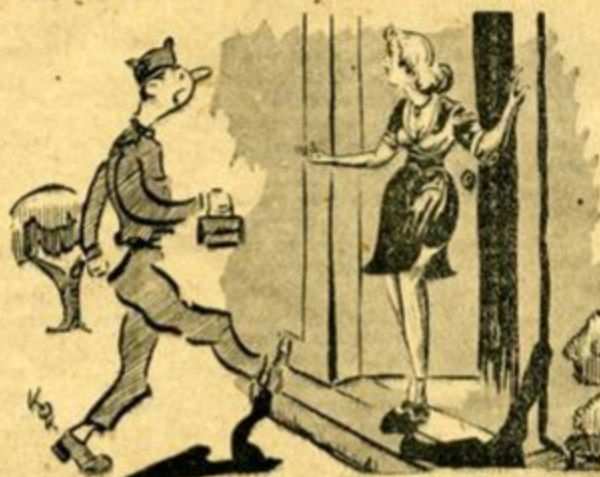
— Ἀπάνω στὴν ὥρα ἔρχεσαι! λούπε ξαναμμένη! Ἡ μαμά εἶ! ναι ἄρρωστη!

Ἀλλὰ ἂν ὁ Βαγγελάρας ἔπεσε θῶμα ἑνὸς τυχαίου περιστατικού κι' ἐχάλασε ἡ δουλειά δὲν ἔπεται ὅτι θὰ ἦμουν κι' εγώ ἄτυχος σὲ παρόμοια περίπτωση. Γι' αὐτὸ ὅταν μιά μέρα πού ἦμουνα με ἄδεια στὴν Ἀθήνα και γνώρισα τὴν Καίτη, μιά ξανθὴ μορφή, ἔβαλα τὰ δυνάτά μου, νὰ τῆς φανῶ ἀρεστάς. — Μαυζέλ! τῆς εἶπα ἡ