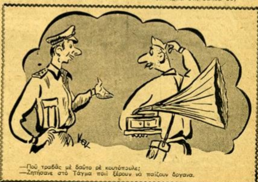
—Πού τραβάς με δαύτο με κουτόπουλε; —Ζήτησαν στο Τάγμα ποιί ξέρουν να παίζουν όργανα.

Οι Μπεκτασήδες διοικούνται υπό άρχιερέως που ονομάζεται «Ντεντέ» (πατήρ), Μερικοί άπ' αυτούς κομμουνίζουν και είναι μέλη της 'Εθνοσυνελεύσεως. Το παρελθόν έτος όταν οι άριστοί της αίρέσεως έζήτησαν από τον «Ντεντέ» Χίλμη να τροποποιήση τα έθιμά τους για να προσαρμοζονται περισσότερο με την κομμουνιστική κυβερνητική γραμμή και για ν' άποφύγουν τυχόν κρατική επέμβαση, ο «πατήρ» άρνήθηκε, έσκότωσε δυό άπ' τους «προοδευτικούς» όπαδούς του και ύστερα ο ίδιος αυτοκτόνησε. Ο 'Αχμέτ Μυστάρ, ένας νέος που έπηρε την θέση του νεκρού, κατάρθωσε μέχρι τώρα να αντίσταθι στις μεταρρυθμίσεις, αλλά είναι άγνωστο, για πόσο ακόμη καιρό θα του έπιτρέψη το (Συνέχεια στη σελίδα 30)