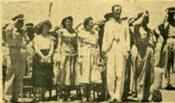
Ο κ. Ράνσιμαν κλπ. έπισκέπται παρακολουθούν την άνάκρουσιν του Έθνικου μας Ύμνου εις τό Γ' Ε.Τ.Ο.