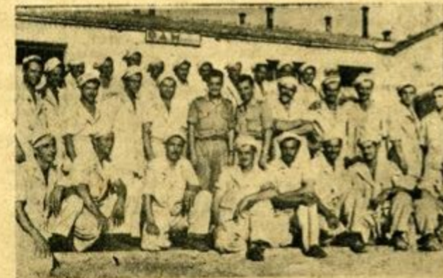
Το προσωπικόν του Στο. Άρτοποιείου Μακρονήσου μετά των επικεφαλής άξιωματικών φοιτησανόμηνον, πρό των ένθουσιασμών του Άρτοποιείου