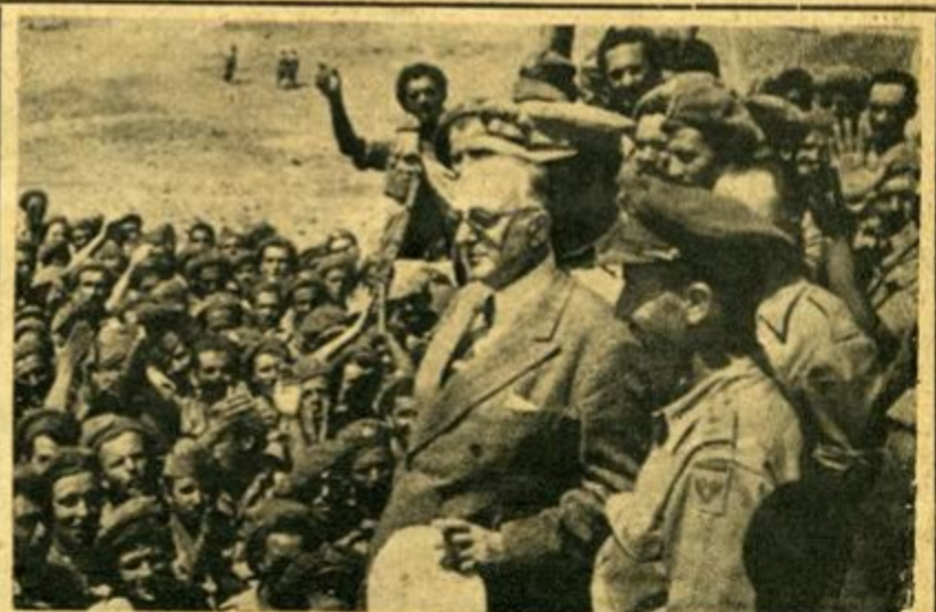
Ό πρώην ύπουργός δουλειτής κ. Π. Μαυρομιχάλης, δατις έπεσκέφθη τήν Μακρόνησο έσχάτως, όμιλει πρós τούς στρατιώτες τού Α' Ε. Τ. Ο. έν μέσω ένθουσιωδών έκδηλώσεων. Πρω' αυτών ό Δ' τής τού Α' Ε. Τ. Ο. ταγματάρχης κ. Α. Βασιλόπουλος.