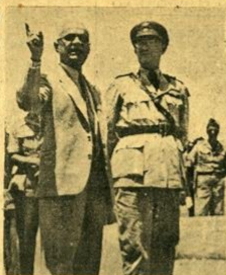
Ἐπίσκεψιν τοῦ Διογ. τῆς Α.Σ.Δ.Α.Ν. καὶ τοῦ κ. Στράτου