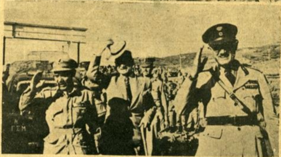
Ἐπίσκεψιν τοῦ κ. Κρόφι