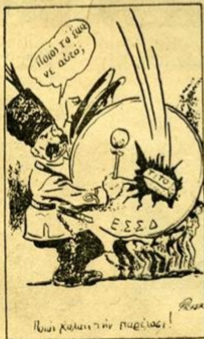
Πῶς καλεῖται τὴν παρτίδα!