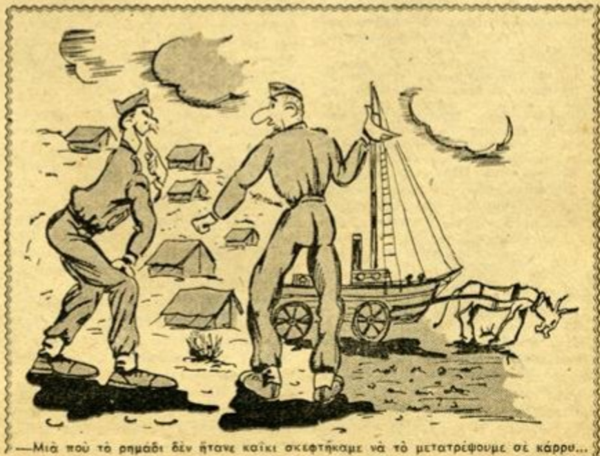
—Μιά πού τὸ ρημάδι δὲν ἦτανε καὶκε ὀκείφτηκαμε νὰ τὸ μετατρέψουμε σὲ κάρρου...

Ἡ ἀτμόσφαιρα πού ἐπικρατεῖ στὰ «Χαϊκὰ Δικαστήρια» πολὺ δύσκολα συγκρατεῖ τὸν ἐπαγγελματία δικαστῆ ἀπὸ ὑπερβάσεις καὶ παρερμηνείας τῶν νόμων ΣΥΝΕΧΕΙΑ ΕἰΣ ΤΗΝ ΣΕΛΙΔΑ 22