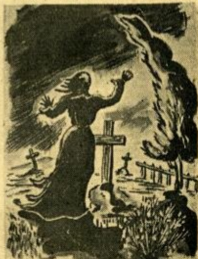
Οι άστραπές φωτίζουν ένα κουφάρι μαύρο πάνω σ' ένα μνημούρι, π' αύρλιάζει.