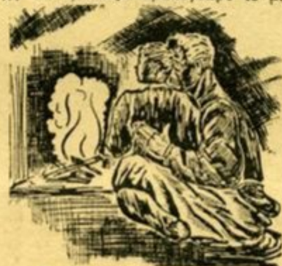
'Ο γέρο Μήλιος έχει στην αγκαλιά του τόν μικρό του εγγονό.

'Αδιάφορο τόν παιδί στού παππού τά λόγια, έχει άκουμπισμένο τόν πηγούνι του στού παραθυριού τόν περβάκι και πασχίζει στο σκοτάδι ν' άγναντέψη την περίπολο τών άνταρτών. Στήν ψυχή του, φωλιάζει πρωτόγνωρο τόν μί-