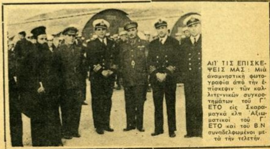
ΑΙ' ΤΙΣ ΕΠΙΣΚΕΨΕΙΣ ΜΑΣ : Μιά άναμνηστικὴ φωτογραφία άπό τήν έπίσκεψιν τῶν καλλιτεχνικῶν συγκροτημάτων τὸν Γ' ΕΤΟ εἰς Σκαρμαγκά κλπ. Αζιωματικοί τὸν Γ' ΕΤΟ και τὸν Β.Ν. συναδελφωμένοι μετὰ τήν τελετὴν.