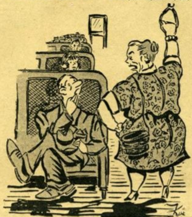
—Φοράς και γραβάτα! Καπίστρι σου χρειάζοτανε!

νώ με κίτταζε με ψυχρό πα, μη δρίσκοντας να πώ καλύτερο. «Μά... γιατί... πρέπει! Ει- «Και γιατί πρέπει δηλαδή!