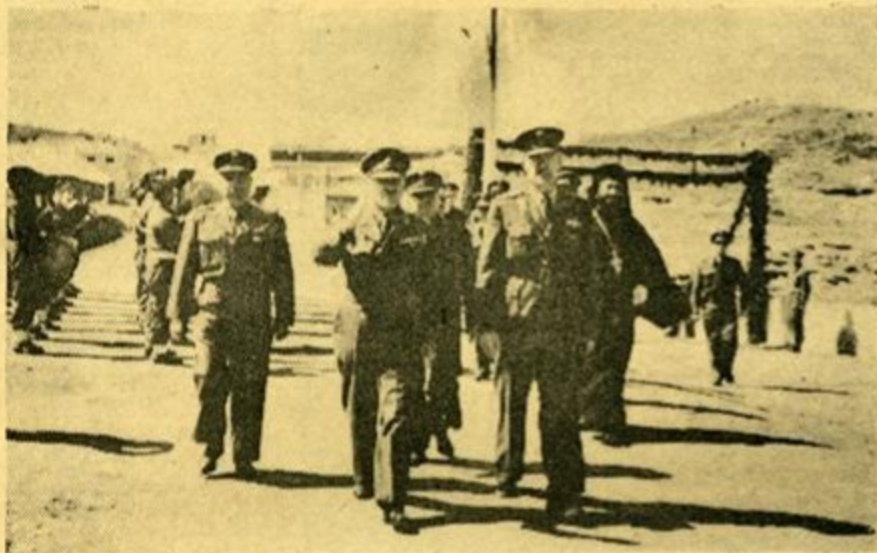
Ο Στρατηγός κ. Βεντήρης, Ταξ. κ. Ζάγκλης κλπ. επισκέπται επιθεωρούν τον καταυλισμόν -ου Γ' Ε.Τ.Ο συνοδευόμενοι υπό του Δ)ντοί ΒΧΙ)Γ.Ε.Σ. Συνταγμ. κ. Γ. Μπαϊρακτάρη, του Γεν. Στρατ)ρχου, συντ)ρχου κ. Ν. Έξαρχάκου.

Καθώς το περιπολικόν διέσχισε τά ίσουχα νερά και κατηβύνητο προς το Λαύριον, ο κ. Βεντήρης και οι μετ' αυτού όρβιοι εις το κατάστρωμα παρηκολούθησαν με καταφανή ίκανοποίησιν τους ένθουσιώντας σκαπανείς, οι όποιοι έξεδήλωσαν για μία άκόμη φοράν τον διακαή τους πόθον να όπλισθούν, να τρέξουν πλάι στα άλλα άνδέρφια τους έκει ψηλά στα Μακεδονικά βουνά και να βοηθήσουν και αυτοί εις την συντριβήν του συμμορισμού, ο όποιος τόσα δεινά έπεσώρευσε εις την γαλανήν μας πατρίδα.