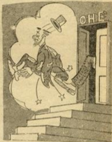
'Αν έμπαινε πός θάβγαίνε