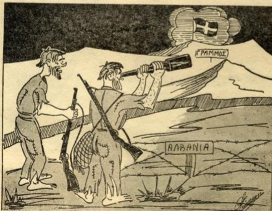
Μή στεναχωριέσαι καπετάνιο και οι 'Ιταλοι έτοι τήν πάθανε τó 1940 στο Γράμμο!

αύγης. Δειλά—δειλά, ξεπροβάλαν στο μισοσκόταδο τά πρώτα σπίτια. Στο σταυροδρόμι του χωριού δίπλα στις βρύσες, μιá όγδοντάχρονη γρηουλά άκουμπισμένη στο ραβδί της σιαυροκοπιότανε.