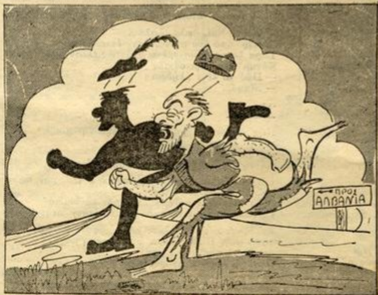
"Αντε ρε φρατέλε καὶ σέφαγα στὴ τρεχάλα !!