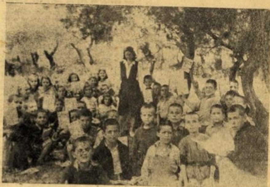
Τὰ παιδάκια ἐπιδεικνύουν μέ χαρὰ τὰ βιβλία τους.

—Τὸ πνεῦμα τους — συνεχίζει ὁ ὀμιλητής μου, είναι ἐξυμωμένο. Ἠθικά καί ἔθνικά στέκει πολύ ψηλά! Ὅμως, πῶς ἀγωνιστήκαμε γιά νά κατορθωθεῖ ἡ κατασκήνωσός μας νά φτάσει στό ψηλὸ ἐπίπεδο πού βλέπετε, μὴν τὸ θαρῶμετε γιά παινία ἂν σᾶς πῶ ὅτι είναι ἄθλος.