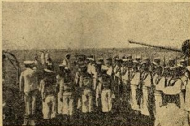
Ἐπίσκεψη τῶν Α.Μ. Βασιλέως καὶ Βασίλισσας σ' ἓνα ἀπ' τὰ πολεμικά μας.