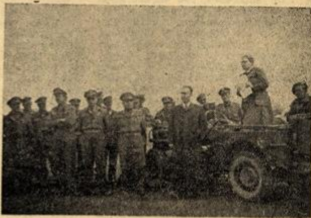
Ἡ «Μάνα» τοῦ Στρατοῦ στὰ σύνορα

Οἱ ὑπηρεσίες πού προσφέρει στὴν Ελλάδα δὲν εἶναι τωρινές. Ἀπὸ τὸν πόλεμο τῆς Ἀλβανίας, καὶ πρὶν ἀπ' αὐτὸν ἀκόμη, εἰδείζε πόσο νοιώθει τὴν Ἑλλάδα. Πάντα σερνῆ στις ἐκδηλώσεις τῆς ἐργάστηκε ἀθόρυβα κα'