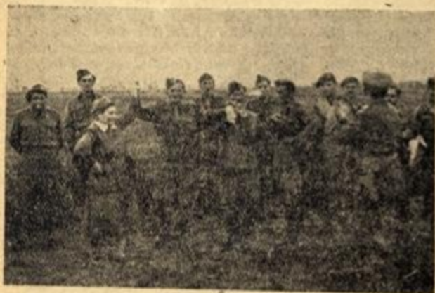
Ἰαζὸ μὲ τοὺς στρατιώτες μας ἡ «Μάνα» διασκεδάζει μετὰ ἀπὸ μιὰ ἐπιτυχῆ ἐπιχείρηση στὰ Πιέρρια

ἀκούραστα γιὰ τὴν Ἑθνικὴ ἐπόθεση. Μάνα καὶ παραστάτης τοῦ στρατιώτη στοργικὸς. Ἐπασχε μὲ τὸν πόνο του, χαϊροῦταν στὴ χαρὰ του. Τοῦ τόνωνε τὸ ἠθικό, τοῦ βάζε φτερά καὶ πέταγε στὴ δόξα.