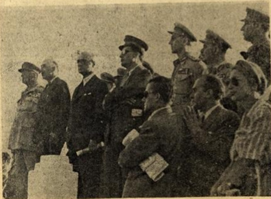
Οι έπίσημοι παρακολουθούν την παρέλαση.

Μέσα στη νύχτα ξεχωρίζονται πιά μόνο τά φώτα τού πλοίου πού λαμπρίζουν πάνω στη θάλασσα. Μαζί τους και τά φώτα πού πήραν όλοι από τό Γ' Τάγμα Σκαπανέων. Τώρα πιά ήλθαν όλοι, είδαν, άκουσαν. Πολλοί κιόλας διδάχτηκαν. Κανείς δέν θά μπορέση πιά έχοντας συνέπεια πρός την σοβαρότητά του να έκτοξεύση συκοφαντίες. Οι κακοί άνθρωποι — πούναί έπάγγελμά τους να συκοφαντούν — τό μόνο πούέχουν να κάνουν τώρα, είναι να σιωπήσουν. Γιατί η άλήθεια έλαμψε άπ' τό Γ' Τάγμα Σκαπανέων σαν ήλιος λαμπρός και στους κακούς έπέβαλε τη σιωπή.