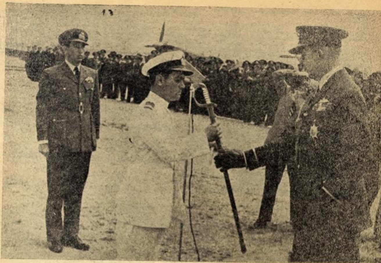
ΑΝΩ. 'Αριστερά: 'Η Α. Μ. ο Βασιλεύς παραδίδει τὸ ξίφος σὲ βνεοορκισθέντα Ἴταρο. Δεξιά: 'Η Α. Β. Υ. ὁ Διάδοχος Κωνσταντῖνος μετὰ τὸ ἀεροπλάνο πὸ τοῦ ἔκαμε δῶρο τὸ Κρατικὸ Ἐργαστῆριον Ἀεροπλάνων στὴν ἐορτὴ του. ΚΑΤΩ. 'Αριστερά: 'Η Α. Μ. ὁ Βασιλεύς παρακολουθεῖ στὸ