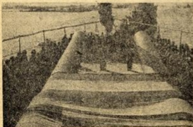
Μιά γιορτὴ στὸν θρυλικὸ μας Ἀβέρωφ.

Πλάι ἦταν μιά μαργαρίτα. Βάφηκε κόκκινη κι' ἔγινε παραροῦνα. Ἦρθε ὁ σκληροτράχηλος νὰ τὴνε κόψει. Πῆγε