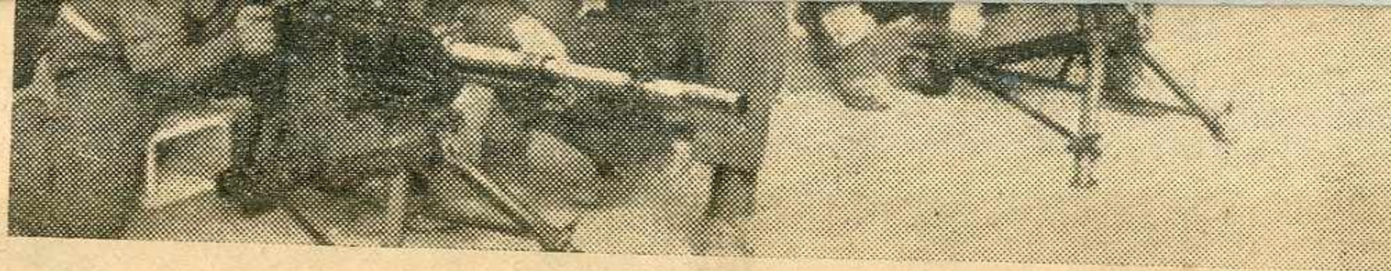
Μ' ένθουσιασμό οι αύριανοί μαχητές παρακολουθούν την εκπαίδευσι εις τα νέα όπλα τα όποία θα δικαιώσουν τις έλπίδες του Έθνους

Ποιά ήταν αυτή ή δύναμις που έσπρωξε τον Πατριώτη αυτόν στην υπέροχη αυτήν πράξι του, που δείχνει τόσο μεγαλείον και όμορφιά ψυχής, τόση άνωτερότητα χαρακτήρος, τόση καρτερικότητα και συναίσθηση τόσο εύρεία του