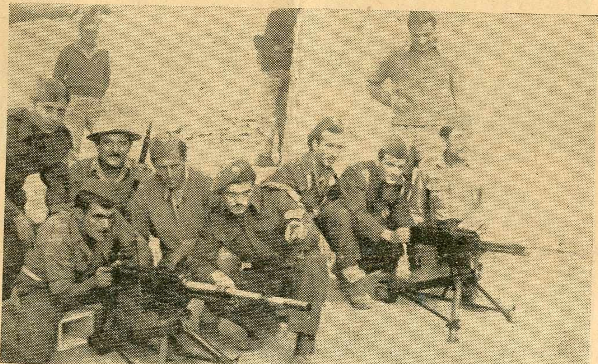
Μ' ἐνθουσιασμό οἱ αὐριανοὶ μαχητὲς παρακολουθοῦν τὴν ἐκπαίδευσι εἰς τὰ νεὰ ὄπλα τὰ ὁποῖα θὰ δοξάσουνο ἐναντίον τῶν προδοτῶν τοῦ ἔθνος.

τίς προόδους πὸν ἐπετέλεσαν στὴ νεὰ τους ἐκπαίδευση, καθὼς και τὴν ἐπιμέλεια πὸν ἐπιδεικνύουνο ἀφ' ὅτου πήραν στὰ χέρια τους τὸ τιμημένο ὄπλο πὸν πρόκειται νὰ δοξάσουνο ἐναντίον τῶν προδοτῶν τοῦ ἔθνος και ἐπιβουλευτῶν τῆς ἐλευθερίας τῆς Χώρας. Μιὰ ἱερὴ συγκίνησι σὲ καταλαμβάνει μόλις βρεθεῖς σιμά τους. Νοιώθεις τὸν ἑαυτό σου νὰ ζῆ τὴν χαρὰ τους, τὸν διάχυτο ἐνθουσιασμό τους τὴν πνοὴ τῆς ὁρμῆς και τῆς πίστεως τους. Τὸν ἄσημο βράχο τὸν μετέτρεψαν οἱ Σκαπανεῖς σὲ γῆ ἡρώων. Τὸ ἀροξοβόλι τῆς Μακρονήσου γίνετα ἀπὸ σήμερον τὸ ὁρμητήριο ἡρώων πρὸς τὴ Δόξα. Δὲν ἀκούγονται πια τὰ κροξίματα τῶν πευλιῶν τῆς θάλασσης. Ἀλλὰ τῶν πολυβόλων και τῶν ντουφεκιῶν οἱ κρότοι πὸν διαλαλοῦνο στὰ γύρω πελάγη τὴν λεβέντικη παρουσία τῆς Μακρονήσου. Τιμὴ και Δόξα στοὺς νέους βλαστουτοῦ Κέντρον τῆς Βασικῆς Ἐκπαιδεύσεως Μακρονήσου.