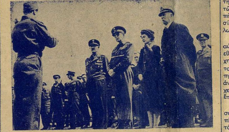
Στρατιώτης τοῦ Τάγματός μας προσφωνῶν τὰς Α.Α. Μ.Μ. τοὺς Βασιλεῖς. Παρα- πλεύρωσ ἡ Α.Β.Υ. ὁ Πρίγκηπ Γεώργιος, δυν)ρχης κ. Μπαϊρακτάρης. Διακρίνονται ἐπίσης ὁ Ὑπουργὸς Στρατιωτικῶν κ. Κανελλόπουλος καὶ ὁ στρατηγὸς Βᾶν Φλῆτ.

Λοιπόν, σύντομα θὰ ἀρ- χίσωμε τὴν δημιουργικὴν ἔργασίαν καὶ θὰ γίνουμε κέντρον τοῦ πολιτισμοῦ. Ἐχομε ἕνα στάδιον ἀ- κόμη, ἀλλὰ θὰ περάσῃ