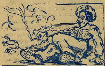
ΓΡΑΜΜΑΤΑ ΤΟΥ ΜΗΤΡΟΥ