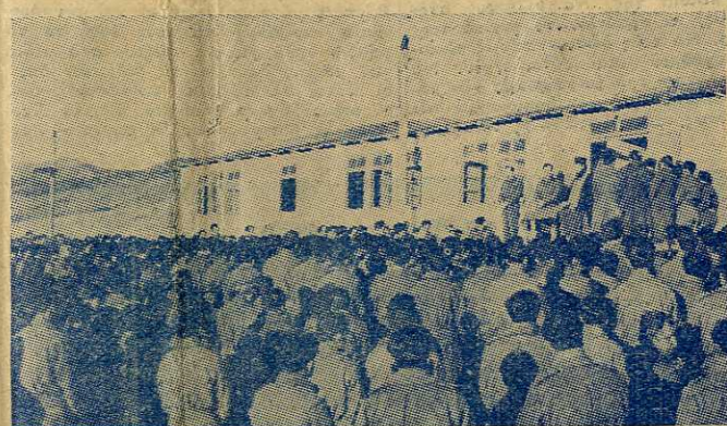
Οι χαιρετισμοί της Θεοτόκου εις το Τάγμα μας.

Ο Χριστιανικός κόσμος τιμά κατ' έξοχήν, όπως είναι γνωστόν την Θεομήτορα, καθ' όλην δε την διάρκειαν της Μεγάλης Τεσσαρακοστής του παρέχεται ή εύκαιρία να εκδηλώση την εύλαβειάν του προς την Υπερμαχόν Στρατηγόν, κατακλύζων τους ναούς εκάστην Παρασκευήν διά να παρακολουθήση τους Οί-