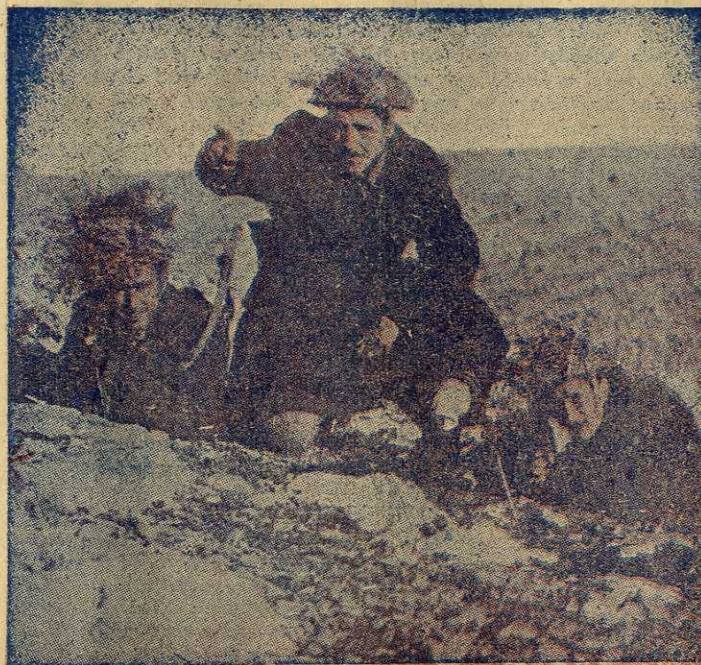
Ἄνδρες τοῦ θρυλικοῦ 596 Τάγματος δίδουν μετὴ φωτιὰ καὶ τὸ ἀτσάλι τὴν πρέπουσα ἀπάντησι τῆς Μακρονήσου εἰς τὰς ὀρδὰς τοῦ Μάρκο καὶ εἰς τοὺς πᾶτρωνές του.