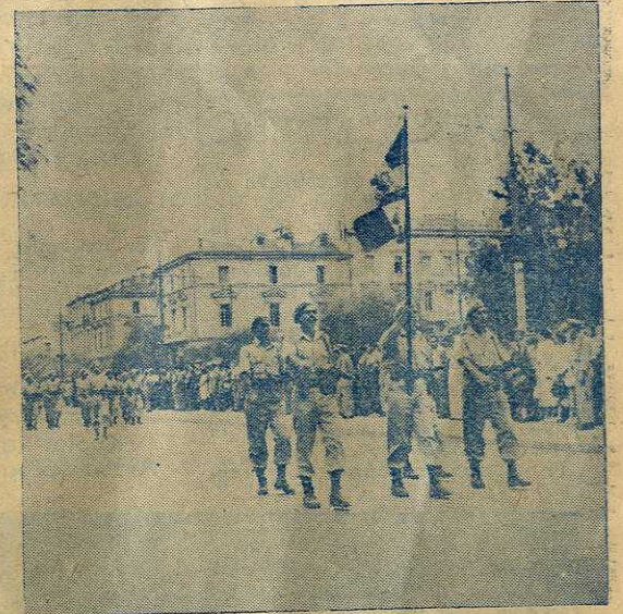
ΑΡΙΣΤΕΡΑ: 'Αντιπροσωπεία των Ταγμάτων Μακρονήσου... ΜΕΣΟΝ: Μερική άποψις του Σταδίου... ΔΕΞΙΑ: 'Ο Νέος 'Ιερός Λόχος»