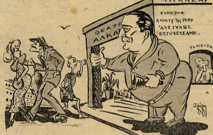
αφ. Γ. Άσημακοπούλου. Η ιστορία αυτή μιλάει εύγλωττα:

άπίρριτος σκηνικός διάκοσμος, ή έρμηνεία τών ρόλων με τούς ζωντανούς και πλούσιους σε συναίσθημα διαλόγους, ήσαν τ'α στολίδια μιάς σεμνής έθνικής τελετής που μίλησε βαθειά στην ψυχή τών Σκαπανέων.