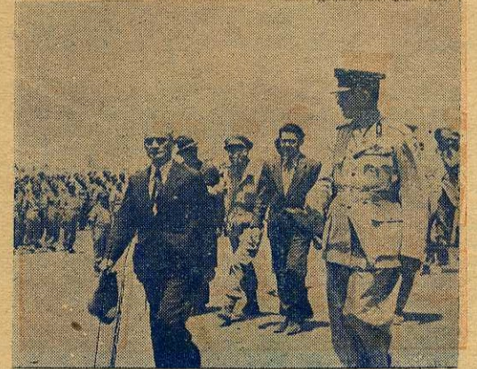
ΕΙΣ ΤΟ ΜΕΣΟΝ: Ἡ ἔπαρσις τῆς Σημαίας στο Τάγμα μας. ΔΕΞΙΑ: Ἀπὸ τὴν τελευταία ἐπίσκεψι τῶν Ἐπισήμων εἰς τὸ Α' Τάγμα Σκαπανέων. Προπορεύεται ὁ κ. Ὑπουργὸς τῶν Στρατιωτικῶν.