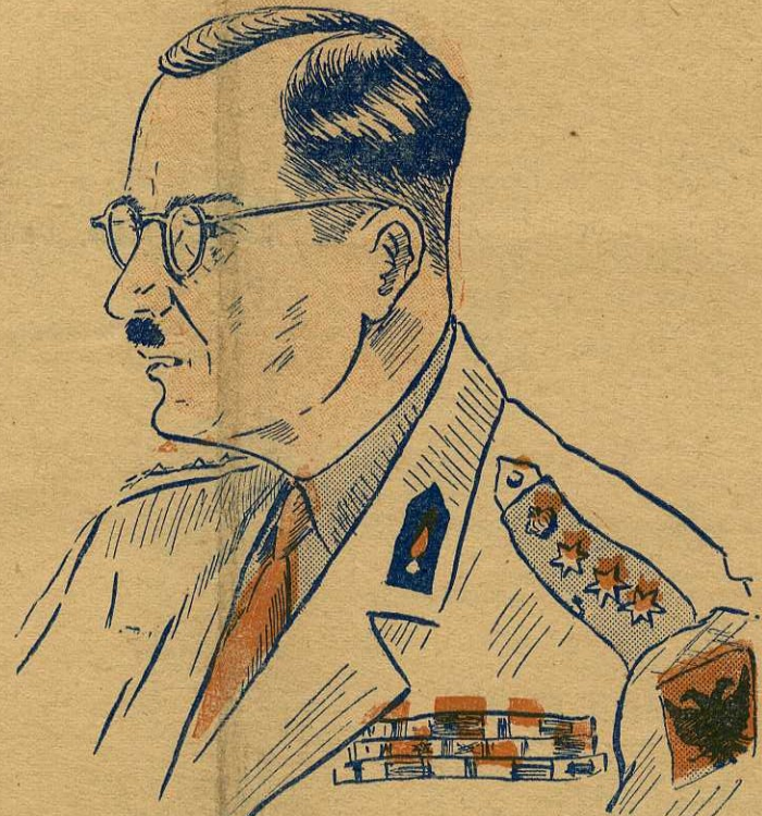
Ο Συνταγματάρχης κ. Μπαϊρακτάρης, εις την έμπνευσμένη καθοδή- γησιν του οποίου οφείλεται το θαύμα της Μακρονήσου.

πιστέψουν στα πλανερά συν- θήματα του πλάνου Σατανά, πρώτα αυτά δίνουν το σύνθη- μα για τον πιο άνελετο ά- γωνα για την εξόντωσί του από τη χώρα μας. Τα πρώτα ένοπλα τμήματα της Μακρονήσου έγραφαν ήδη την τιμημένη μας Ιστορία. Κληρονομία αίματος, ηρωί- σμου και θυσιών μας θαρυνει. Και όσοι ακολουθούν, δεν πρέ- πει απλώς να βαδίσουν πάνω στα ίχνη των πρώτων. Οφεί- λουν να τους υπερτερήσουν. Πρώτοι πάντοτε μεταξύ των πρώτων, έτοιμοι για μεγάλα έργα και μεγάλες θυσίες. Να περιβάλουμε την Μακρόνησο με αίγλη, με φως, με ηρωί- σμόν. Να άποτελή εις το μέλ- λον ύποθήκην υπερβολής του καθήκοντος, ένγυθριν πειθα- ρχίας και γενναιότητας. Με αυτές τις εύχας και αυτά τα συναισθήματα θα άπο- χειρηθώμε μεθαύριον το Τάγμα που φεύγει για τις έ- πιχειρήσεις. Αυτές τις ελπίδες τρέφομεν, αυτές τις προσδοκίες περιμέ- νομεν από τα φανταράκια που ηγαίνοντο να πολεμήσουν για το μεγαλειό της Πατρίδος. Και μία είναι η άπαιτησίς μας, άπαιτησίς 15.000 άγωνι- όντων ΕΛΛΗΝΩΝ: Να θυμα- τουργήσουν εκεί που θα πεί, να γράψουν σελίδες δόξης, για να φύσωμε και μες γρή- ντρα από εδώ, να έλθη η πο- θητή ημέρα που η Μακρόνη- σος θα παραδεινή άδεια, άλ- λά το όνομά της θα συμβολί- ζη την δόξα και την άγάπη προς την Πατρίδα.