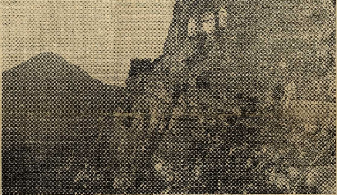
Τὸ Μοναστήρι τῆς «Παναγίας τοῦ Βράχου» εἰς τὴν Νεμέαν.