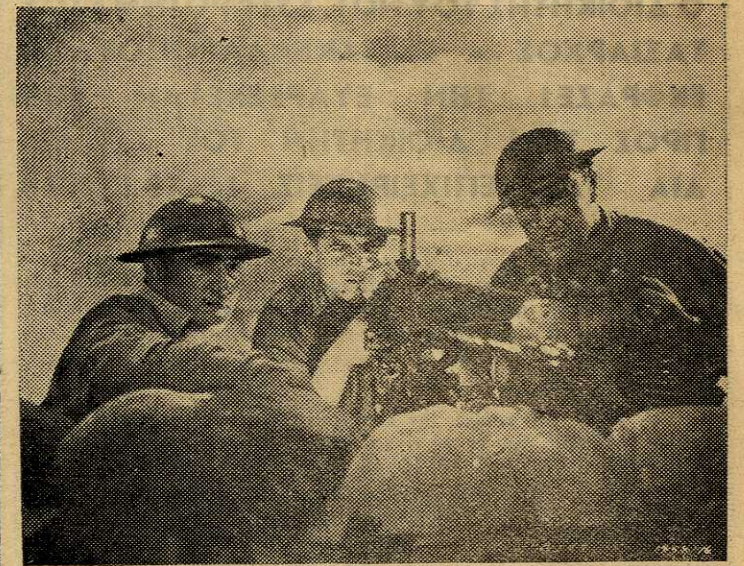
Μία χαρακτηριστική σκηνή από τόν έργον «'Επεσαν μέχρις ενός». Δεξιά ο διοικητής της Φρουράς, ως γεμιστής, στο τελευταίο πολυβόλο που έμεινε....

σης, οι Γιαπωνέζοι έτοιμάζονται, επί τέλους, για άπόδρασι, πιστεύοντας, ότι στο Γουέικ δεν θα είχε μείνει ούτε ίχνος ανθρώπινης ύπαρξεως. 'Αλλά ξαφνικά δέχονται τά πυρά τών όλίγων πυροδόλων ιού Γουέικ, τά όποια άρχισαν να βάλλουν, όταν τόν σχέδιο της «σιωπής», που είχε συλλάβει και έφαρμόσει ο διοικητής, είχε πλέον ώλοκληρωθή. 'Ομως τά πυρομαχικά τελειώνουν και τέλος οι Γιαπωνέζοι, παρ' όλες τις απώλειές τους, κατορθώνουν και καταλαμβάνουν τή μικροσκοπική νησίδα Γουέικ, εάν ένδιεφέρετο ιδιαίτερα γι' αυτήν τόν Γ.Ε.Σ. και, με τήν φροντίδα του, κατώρθωνε να προβληθή