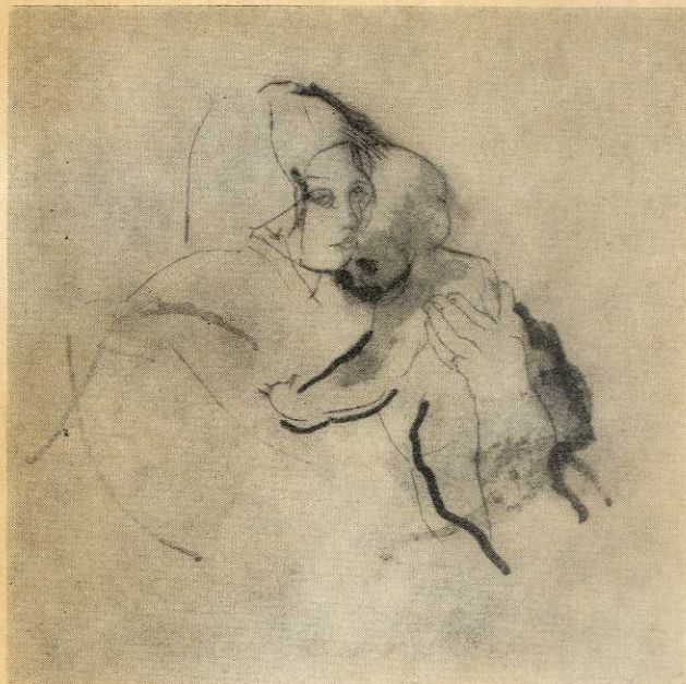
ΣΧΕΔΙΟ ΑΝΝΑΣ ΚΙΝΔΥΝΗ