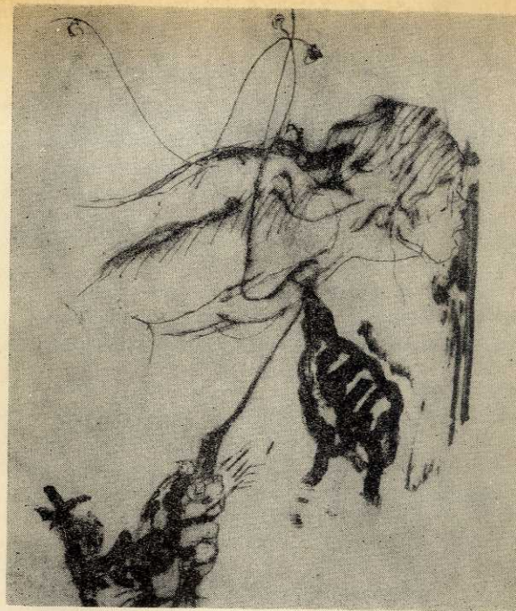
ΣΧΕΔΙΟ ΑΝΝΑΣ ΚΙΝΔΥΝΗ

Ἡ ἀγωνία μας μεγαλώνει. Ξέρουμε πὼς τὸ νά σέ τραβήξουν στή θάλασσα σημαίνει πὼς μπορεῖ νά σέ κλείσουν σ' ἕνα τσουβάλι, μαζί μὲ μιά γάτα, νά σέ δέσουν καὶ νά σέ ρίξουν μέσα! Εἶχαμε μάθει πὼς ἔτσι ἔκαναν πρὶν ἀπὸ μᾶς τοὺς ἄντρες κρατούμενους.