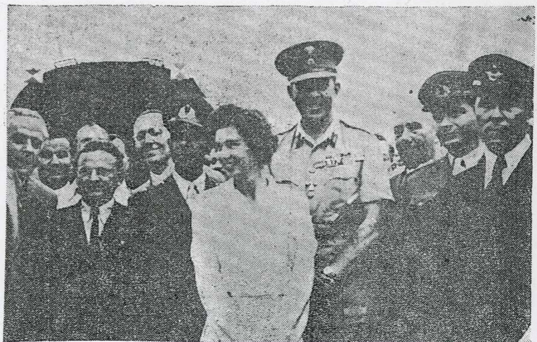
Ὁ Βασιλεὺς καὶ ἡ Βασίλισσα εἰς τὰ σύνορα, ἐν μέσῳ Τούρκων ἀξιωματικῶν, κατὰ τὴν περιοδείαν των εἰς τὴν Βόρειον Ἑλλάδα.